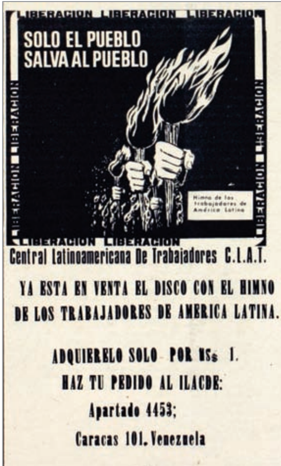
Figura 4. Publicidad del disco con el Himno de los trabajadores de América Latina