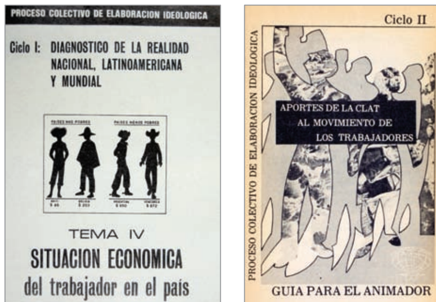
Figura 3. Cuadernillos de formación correspondientes al Proceso Colectivo de Elaboración Ideológica (1973-1977)