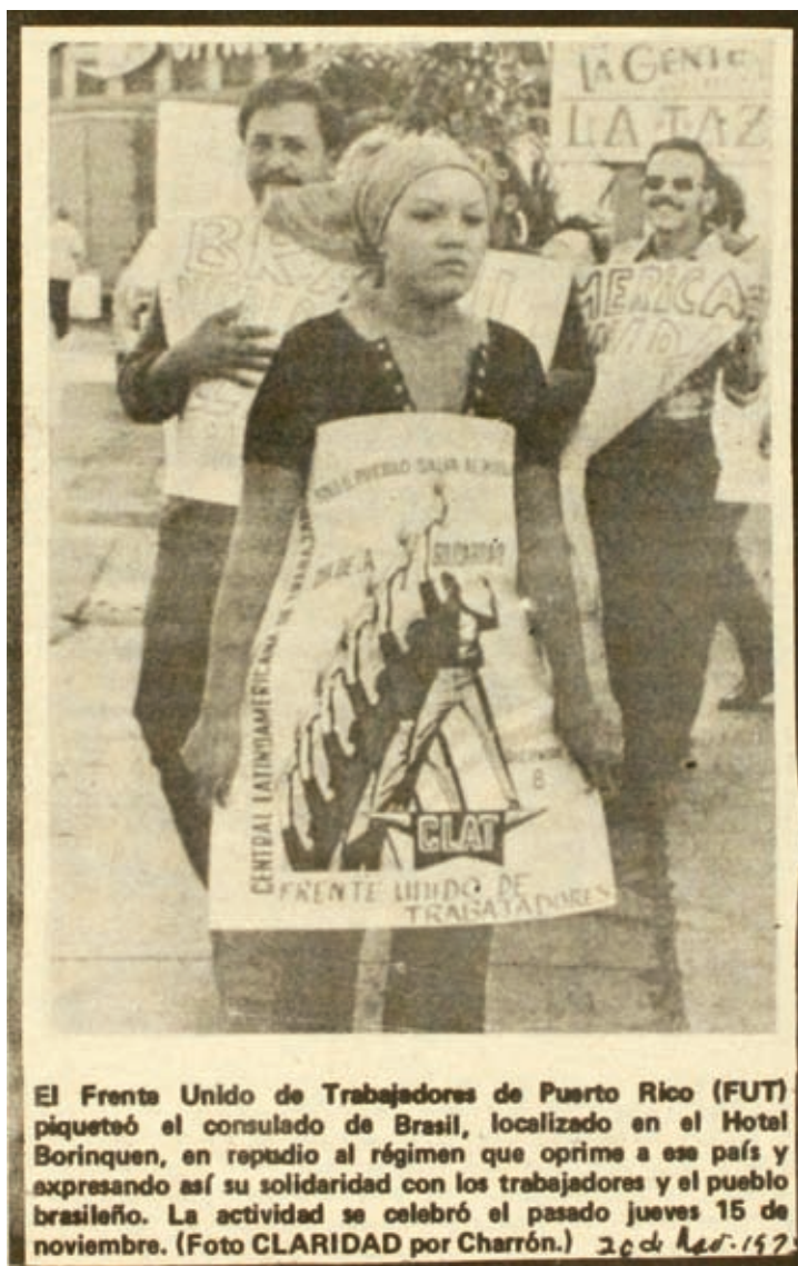
Figura 1. Mujer puertorriqueña en jornada de solidaridad con los trabajadores de Brasil (1973)